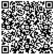
Anni Albers Biografie