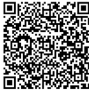
Anni Albers Arbeiten