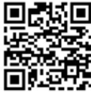
Anni Albers Arbeiten