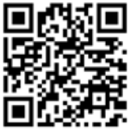
Anni Albers Biografie bauhauskooperation.de